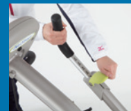
簡単なアームの調整