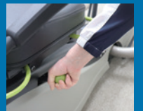
10段階の負荷レベル調節 (コンソール表示有)