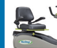
8つの方向から乗降り出来る 360°回転シート