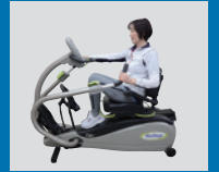
上肢の運動 身長の高い方も足を適切に 置ける設計