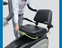
15段階のシート調節 (コンソール表示有)