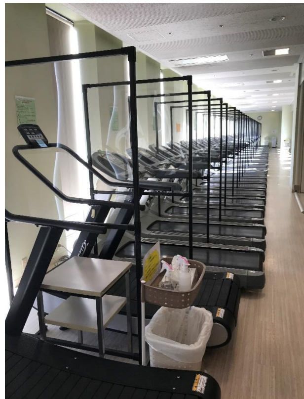
(東京ドームスポーツ様_フィットネスクラブ東京ドーム_パーテーション設置風景)