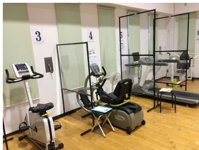
(にのみやシニアフィットネス様_パーティション設置風景)