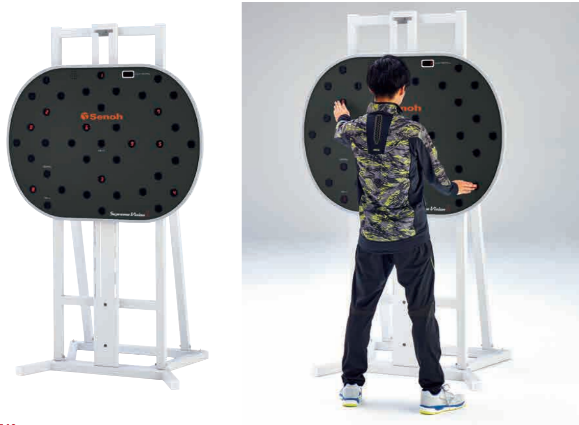
BZ9540 スープリュームビジョンL スタンドタイプ 本体価格：¥750,000+税(台)

人間の五感の中でもっとも情報を得られるために使用されている視覚をトレーニングすることで、より多くの情報を入手し判断する、様々なスポーツ能力の向上はもちろん、身体との協調動作による脳の活性化・先を読むイメージ力の向上などが期待できます。