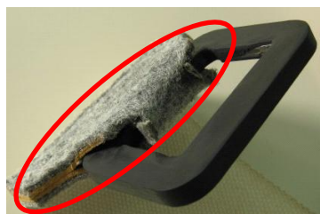
ベルト両側の破損（要交換状態）